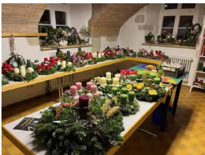
Adventsverkauf 2024 im Pfarrhaus