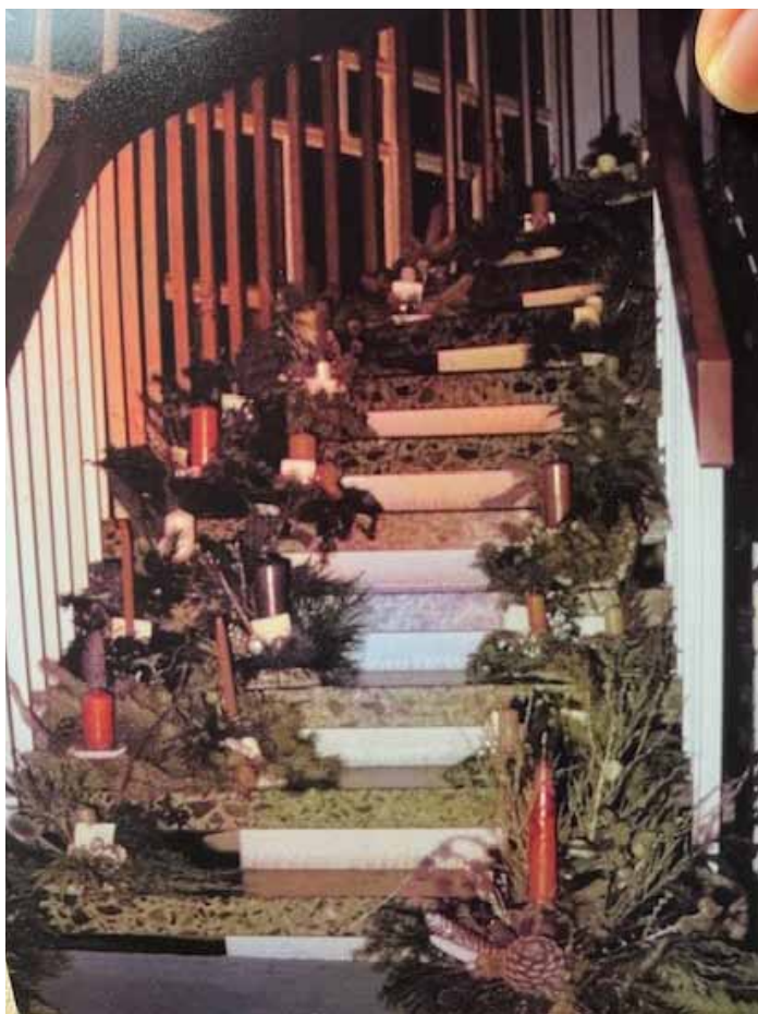
Adventsverkauf 1979 im Rathaus